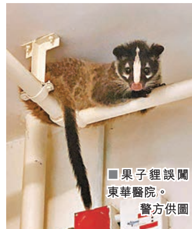
■果子狸誤闖東華醫院。

新型冠狀病毒肺炎襲港恐慌下，一隻野生果子狸昨晨被發現闖入上環東華醫院。院方報警求助。漁護署派員到場捉走轉交獸醫檢驗，警方列作「發現動物」案處理。