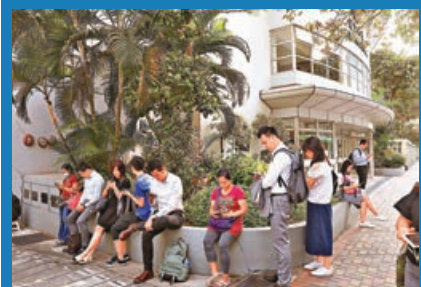
■喇沙小學外出現排隊等候遞交小一入學表格的家長。