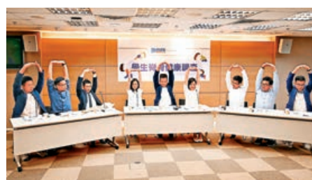
■民建聯調查發現，中小學家長指子女有腰痛等脊骨問題，情況令人關注。

受脊骨評估及檢查，學校亦可推出「共用課本」政策、理順時間表及增設儲物櫃，減少學生攜帶課本數量從而減輕書包負擔。此外，學校及社區也應加強護脊的宣傳教育，家長多提醒子女留意日常姿勢，一同幫助學生維持脊骨健康。