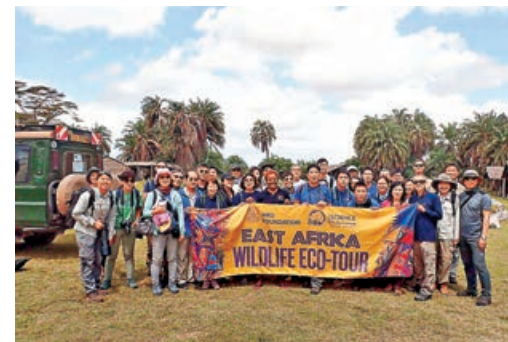
■15名港大生遊歷非洲，體驗生態。

受脊骨評估及檢查，學校亦可推出「共用課本」政策、理順時間表及增設儲物櫃，減少學生攜帶課本數量從而減輕書包負擔。此外，學校及社區也應加強護脊的宣傳教育，家長多提醒子女留意日常姿勢，一同幫助學生維持脊骨健康。